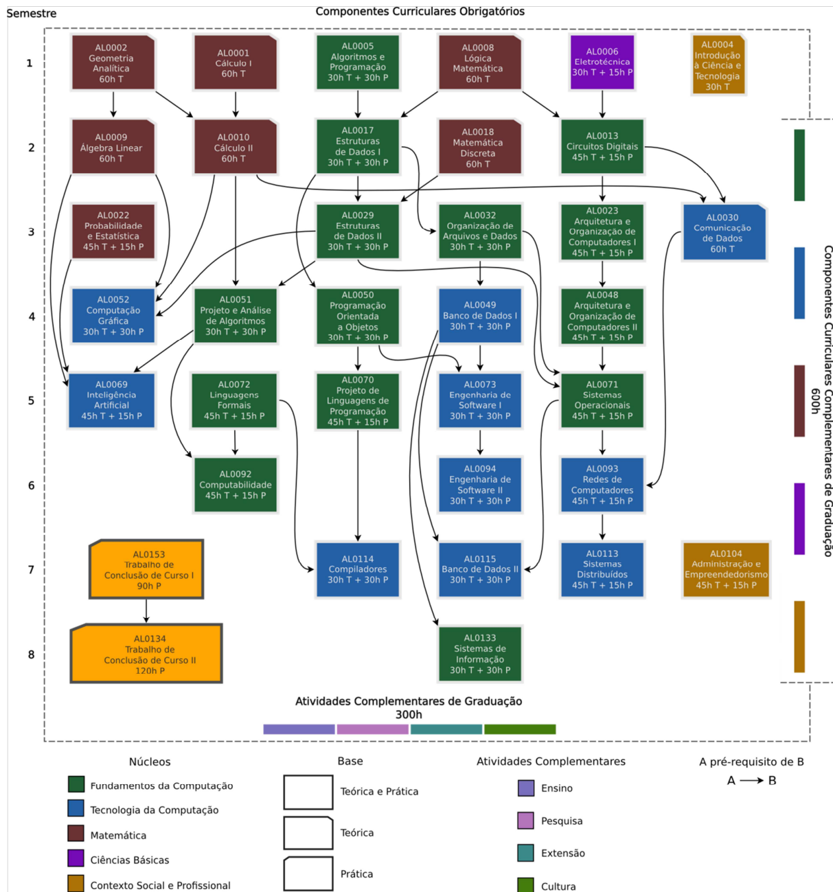
Figura 5 – Matriz Curricular.

Além disso, a participação do discente em atividades complementares (ACG) de ensino, pesquisa, extensão e cultura é incentivada desde o primeiro semestre, prosseguindo por todo curso e dando base para sua formação humana e profissional generalista e sem fragmentações. Para auxiliar e incentivar o aluno a participar de atividades complementares nos quatro grupos, o curso possui docentes vinculados a grupos e diversos projetos nesses âmbitos (veja APÊNDICE 2: FORMAÇÃO DOCENTE).