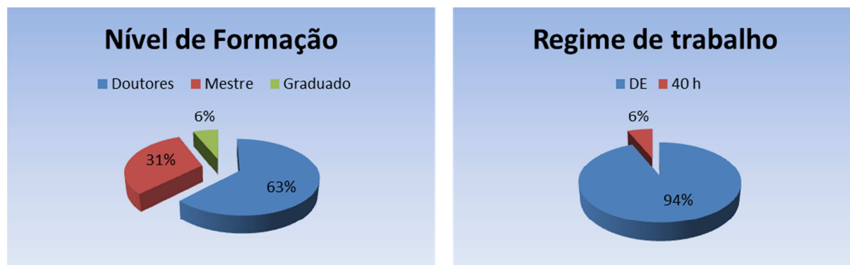
Figura 6 – Gráfico à esquerda, percentual de docentes atuantes no curso de Ciência da Computação considerando seu nível de formação. No gráfico à direita, percentual de docentes quando ao regime de trabalho. Em ambos os gráficos esta sendo considerado o docente substituto.

O corpo docente deve estar consciente do seu papel, enquanto sujeito envolvido e responsável pela efetivação deste Projeto Pedagógico de Curso. Deve assumir comportamentos e atitudes no desempenho de suas funções, visando atingir os objetivos do Curso de Ciência da Computação.