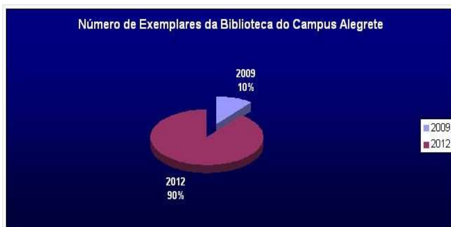
Figura 8 – Crescimento do número de exemplares da Biblioteca do Campus Alegrete.

A política de renovação dos livros e periódicos é realizada através de solicitações de pedidos de compra preenchido pelos docentes, efetuados regularmente, com o objetivo de atender as necessidades das componentes curriculares do curso, segundo normas do MEC estabelecidas para bibliografia obrigatória e complementar, além das atividades de pesquisa, extensão e de caráter cultural.